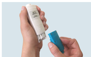
Cambio sencillo de sonda en los testo 206-pH1/-pH2/-pH3