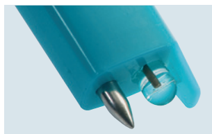
testo 206-pH1: sonda pH1 para líquidos