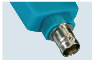
testo 206-pH3: sonda pH3 con conector BNC