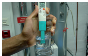
Ideal para comprobación de agua de calefacción conforme a VDI 2035.